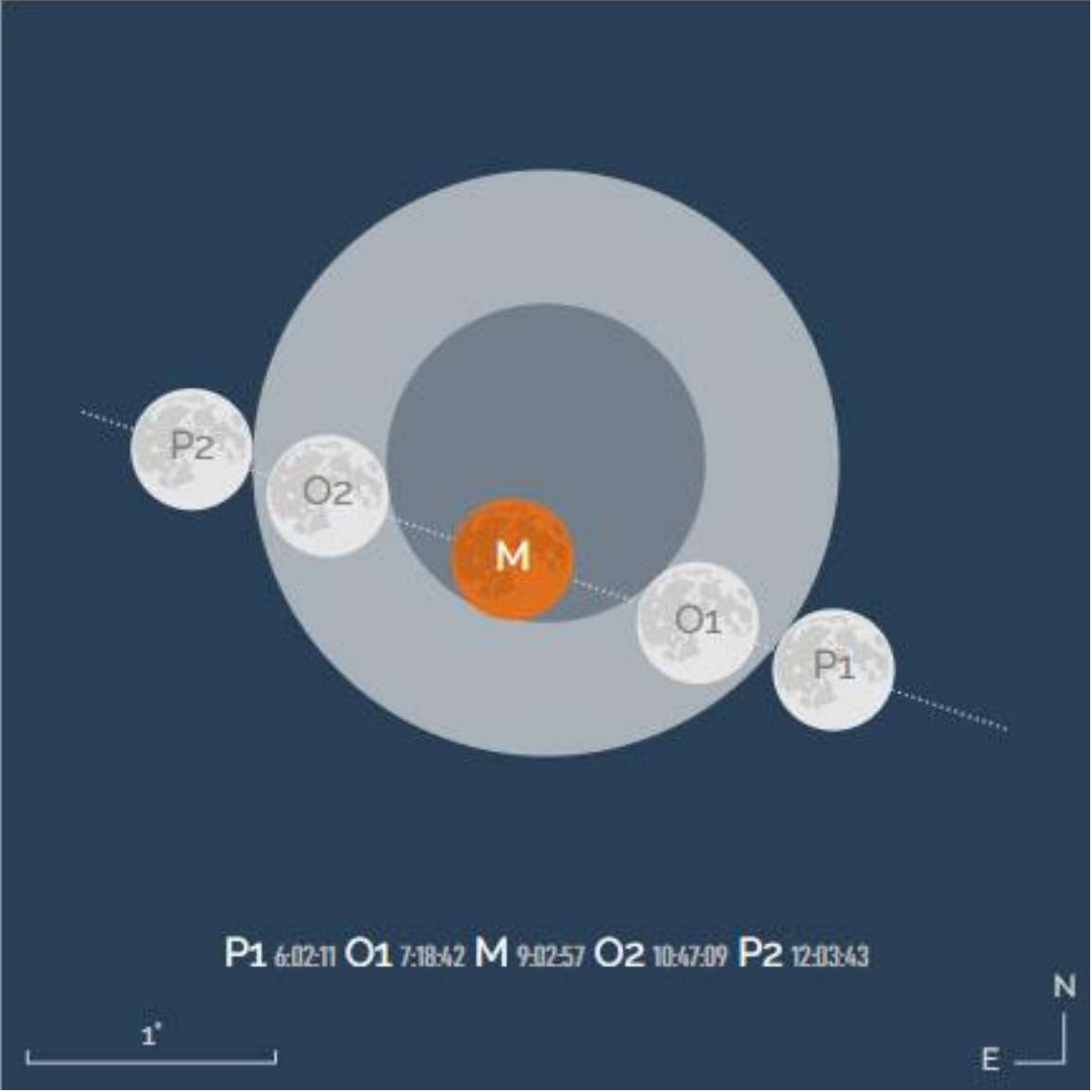
Passage de la Lune dans l'ombre de la Terre